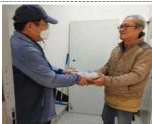
▲ 결손장애 가정 반찬 나눔