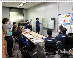
▲ 분임조 활동 사진