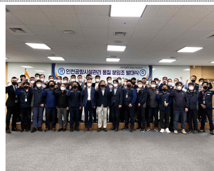
▲ 사업본부 품질 분임조 발대식

분임조 활동을 통해 우리 회사가 제공하는 공항 시설관리 품질이 향상되고 직원들의 연구개발 및 개선활동 문화가 조성되기를 기대합니다!