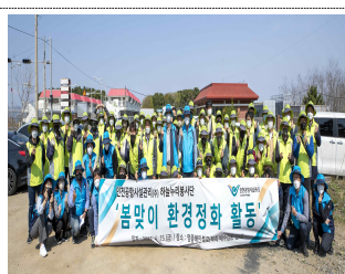
▲ 봄맞이 환경정화 봉사 활동