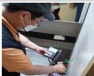
▲ 안전사고 예방을 위한 누설 전기 점검