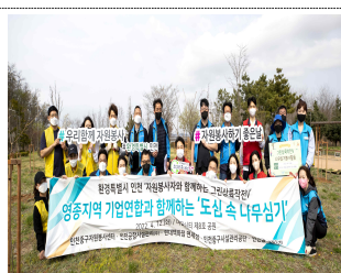
▲ 도심 속 나무심기 봉사 활동

우리 회사 자원봉사단인 '하늘누리봉사단'은 작년 5월 창단되었으며 코로나19 일상회복 전환조치 등에 따라 올해는 더 활발하고 다양한 활동을 계획하고 있으므로 임직원 여러분의 많은 관심과 참여 바랍니다.