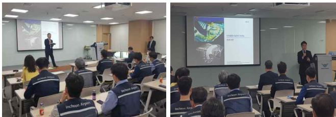
▲ 6월 15일 관리자 세션 설명회

이러한 과정들이 우리 회사가 하나의 회사, 하나의 팀으로 내부역량을 결집하는 계기가 되기를 바라며 지속해서 직원과 소통할 예정이오니 끊임없는 관심과 참여 부탁드립니다.