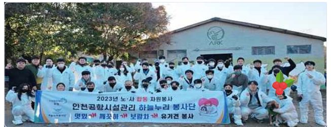
▲ 유기견 보호소 봉사활동 단체사진

이번 봉사활동을 통해 유기견들에게 조금이나마 도움이 되길 바라며, 앞으로도 기업의 사회적 책임을 위해 다양한 활동을 적극적으로 실천하는 인천공항 시설관리가 되겠습니다. 이번 봉사활동에 참여한 임직원분들 및 봉사 참여에 따른 업무에 빈자리를 채워주신 임직원분들께 감사의 말씀을 전합니다.