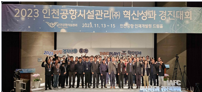
▲ 2023년 혁신성과 경진대회 1일자 단체사진

11월 17일에는 'IAFC 혁신 Day' 행사를 개최하여 각 부문별 시상 및 각 부문 최우수팀의 발표를 통해 혁신 우수사례를 공유하는 시간을 가졌습니다.