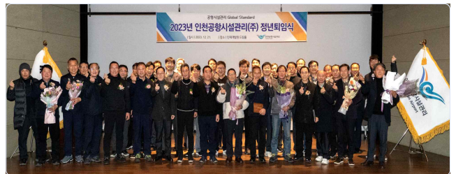
▲ 2023년 정년퇴임식 단체사진

다시 한번 모든 정년퇴임자분들의 정년퇴임을 축하드리며 늘 건강과 행복이 가득하기를 기원합니다.