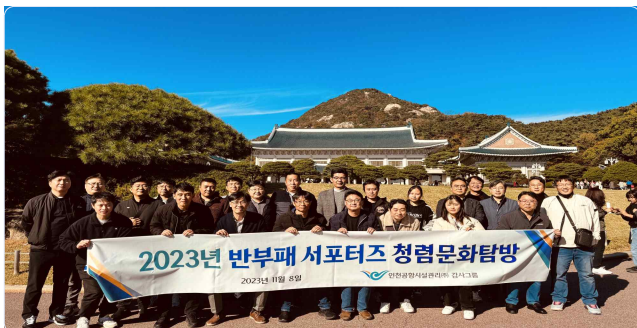
▲ 2023년 반부패 서포터즈 청렴문화탐방 단체사진

이번 우리 선조들의 청백리 발자취 답사 및 현장 체험을 통해 다시 한번 청렴 마인드를 함양할 수 있었으며, 2024년에도 이러한 마음가짐을 지니고 반부패 서포터즈의 일원으로 활동할 것을 다짐하는 계기가 되었습니다.