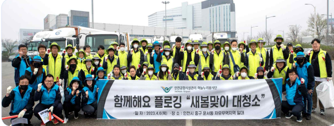
▲ 새봄맞이 대청소 봉사활동 모습