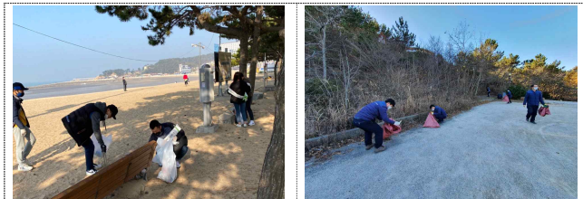
〈T1건축시설〉 올망리 해수욕장