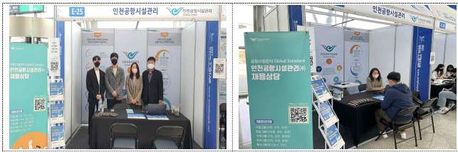
▲ 2022 항공산업 잡페어 홍보부스 모습

우리 회사는 지난 10월 27일부터 28일까지 이틀 간 국토교통부가 주최하고 항공일자리 취업지원센터가 주관하는 '2022 항공산업 잡페어(JOB FAIR)'에 참여했습니다. 인천공항 제1여객터미널 교통센터에서 우리회사 인사팀 팀원들이 기업 상담 및 홍보 부스를 운영했습니다. 이날 우리 회사 인사팀 채용담당자는 “이번 2022 항공산업 JOB FAIR를 통해 참가자들이 실질적인 도움을 얻었길 바란다”며 “앞으로도 채용상담과 채용설명회, 멘토링 등 다양한 프로그램을 통해 채용 관련 정보를 드릴 수 있도록 노력하겠다”고 전했습니다.