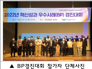
▲ BP경진대회 참가자 단체사진

우리 회사는 혁신 사례를 발굴하고 직원들의 혁신 활동을 격려하기 위해 지난 10월 25일 '제2회 혁신성과 우수사례(BP) 경진대회'를 개최 했습니다. 이번 공모를 통해 90건의 우수사례를 접수받았고, 1차 심사에서 10건의 사례를 선정했습니다. 이번 경진대회는 임직원들과 혁신성과를 함께 공유하기 위해 '직원 평가단'을 처음 도입하였으며, 내·외부 평가위원의 발표심사 점수와 직원 평가단의 투표 결과를 합산해 최종순위를 결정했습니다. 심사 결과 화재감시 시각 지역을 발굴해 화재 발생 초기에 감지할 수 있도록 시스템을 구성한 전력운영사업소의 '태양광 발전설비 화재대응 초기화재경보 시스템 구축'이 최우수상으로 뽑혔습니다. 이 밖에도 우수상에는 열원사업소, 전력운영사업소 각 1건이 선정됐습니다. 또한 T1수하물사업소, 보안교통사업소 각 1건이 장려상을 받았습니다.